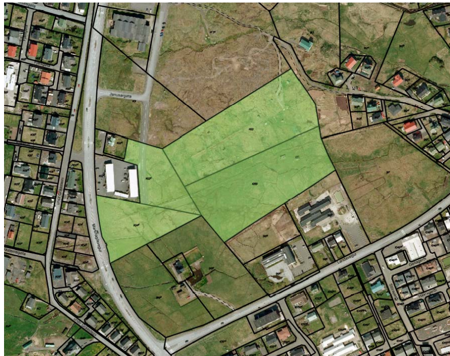
Luftmynd - Byggiðkið_kortal.fo