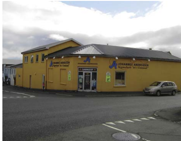
Keypmadurinn 'uti i Grønlandi' har taget navn efter kvarteret.

På trods - eller måske på grund af den meget forskellige bebyggelse opleves kvarteret som samlet hele, et levende kvarter under stadig udvikling, rig på hustyper, former og farver. Fællestræk er forskelligheden og at bebyggelsen er væsentligt tættere end omliggende bebyggelser.