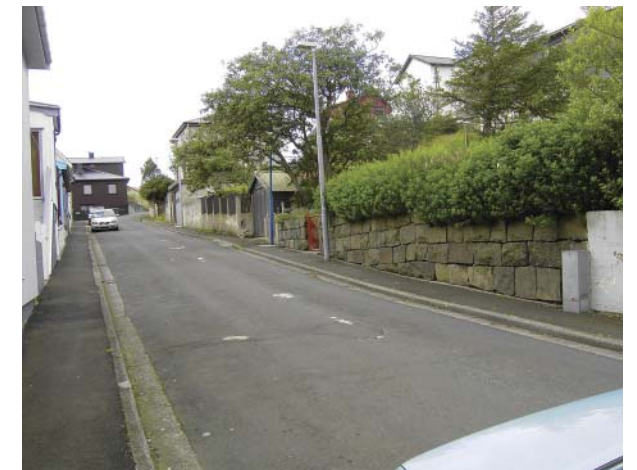
Den nordlige side af Leivsgøta, grøn og med forhaver. Husene ligger her tilbage på grundene.

Det ubebyggede areal på hjørnet af Jákup Nolsøes gøta og Eiriksgøta ligger som et sår i kvarteret. Bagved ses fortsættelsen af Jákup Nolsøesgøta, som formodentlig er bebygget senere, jf. kort fra 1950.