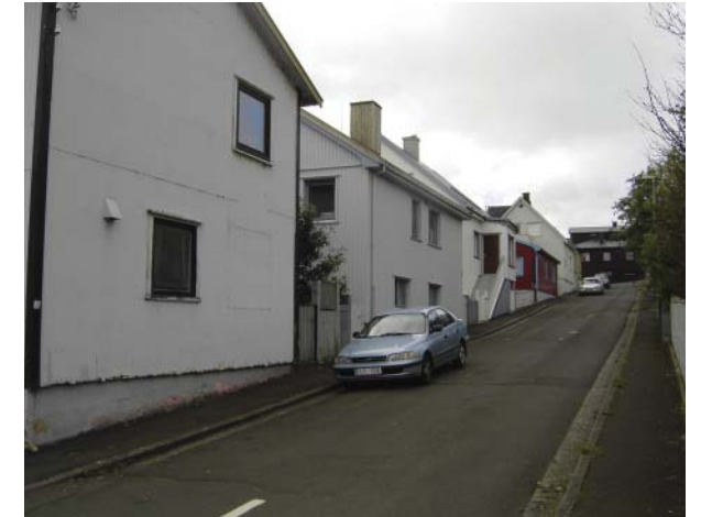
Den sydlige side af Leivsgøta, tæt og bymæssig med husene placeret helt ud til fortovet.

Afgrænsning til gade/fortov er overvejende stakitter mellem støbte betonpiller over en grund af beton. Ligesom husene er forskellige har hvert hus også sin egen udformning og farve på stakittet, flere steder også ses gammeldags stengærder og gærder i beton.