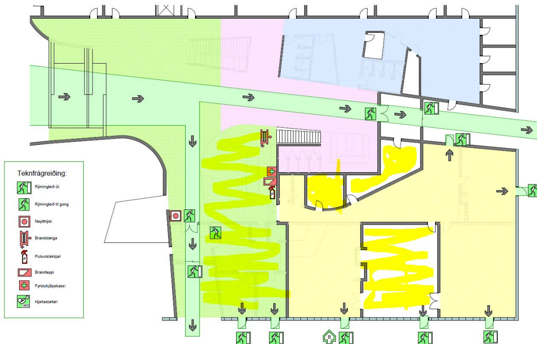
Rýmingarætlun Fritíðarskúlin á Flötum Oyggj 1