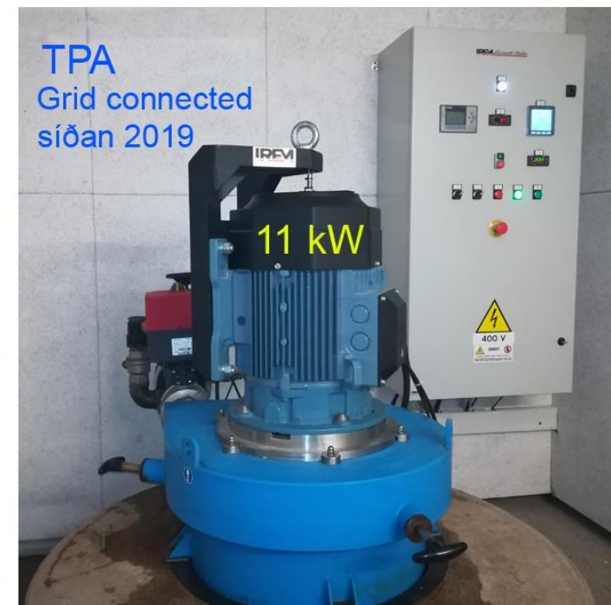
TPA Grid connected síðan 2019