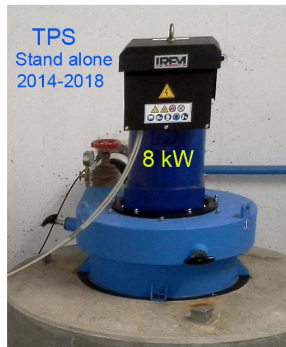
TPS Stand alone 2014-2018