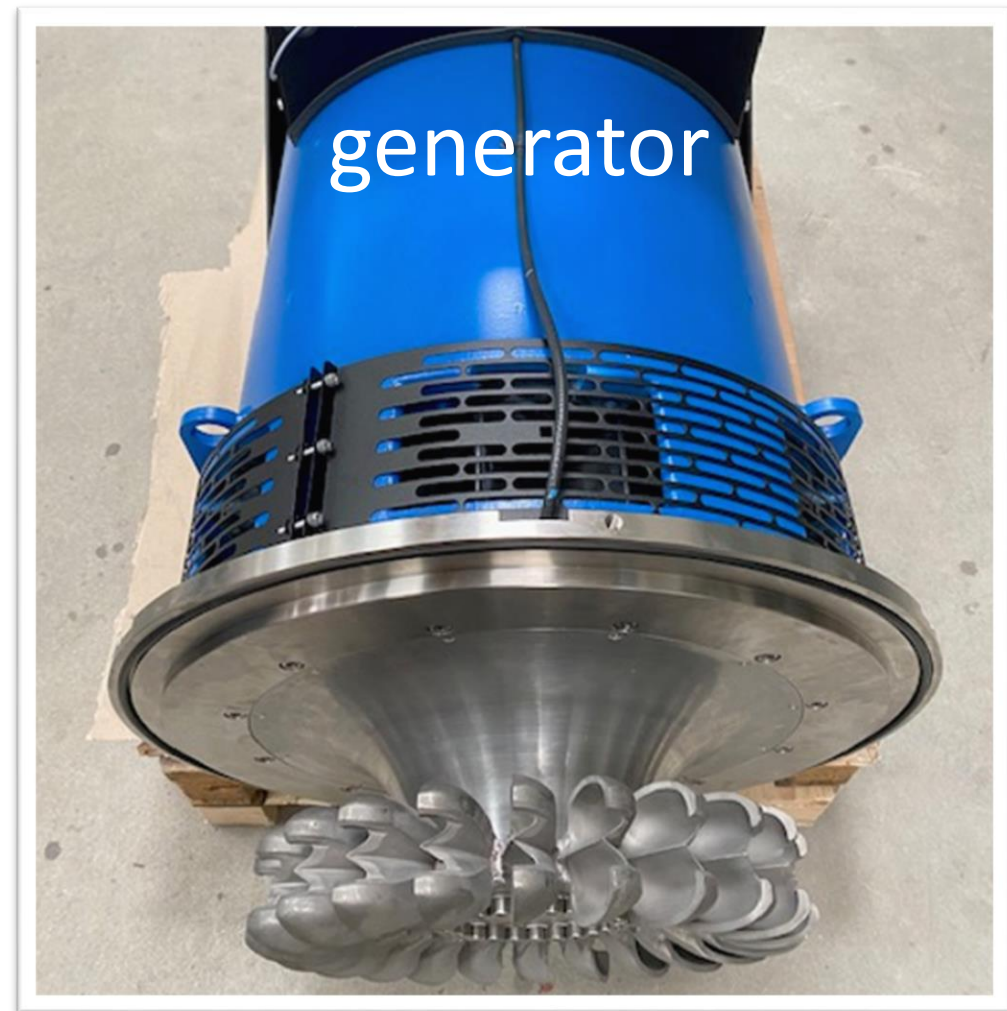
IREM vatnmylla við 6 dysum og pelton hjóli